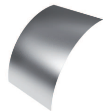
TAPA VE'R'-90 ZMX 'A'x'P' AL